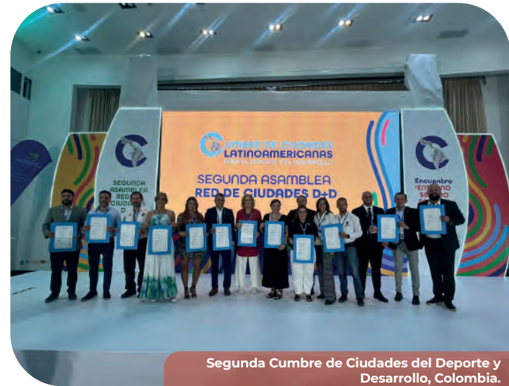
Segunda Cumbre de Ciudades del Deporte y Desarrollo, Colombia.

Para mantener a la población informada respecto a las actividades que se realizan en el Estado y, sobre todo, de los logros que los deportistas tienen a nivel local, nacional e internacional, publicamos el boletín denominado, Deporte en Baja California, el cual resume los principales eventos efectuados, mismo que se reparte físicamente en oficinas de gobierno y a través de medios electrónicos y redes sociales a la población en general.