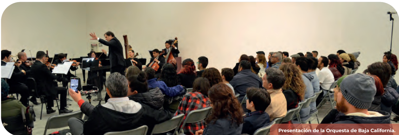
Presentación de la Orquesta de Baja California.

En el periodo informado, se desarrollaron los talleres del Proyecto Isla, Costa y Territorio y Agrupaciones Redes en donde se beneficiaron 447 NNA y jóvenes pertenecientes a las agrupaciones de reciente creación que comprende: Coro Juventud Isla de Cedros y Ensamble La Nebulosa de Isla de Cedros, el Coro Infantil Xantusii de Ensenada, el Ensamble de Cuerdas Altiplano y el Ensamble de Alientos de El Refugio, así como las Orquestas y Coros Redes de Tijuana y los espacios comunitarios que tienen presencia en las colonias Mariano Matamoros, Castillo, Guaycura y Sánchez Taboada de Tijuana; Encuentro Coral Pacífica, Encuentro Orquestal Entre Mares, Campamento musical EnRedate Intercambios de Verano con la Fundación Music Bridges Borders en Sandpoint, Idaho.