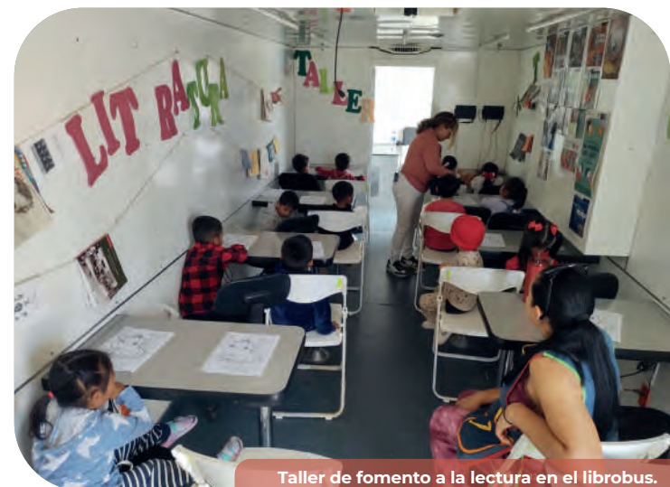
Taller de fomento a la lectura en el librobús.

Con el objetivo de brindar oportunidades de acceso a la cultura en colonias ubicadas en la periferia de la ciudad, se impartieron actividades de fomento a la lectura con el programa “La Biblioteca en Tu Escuela”, beneficiando a más de un mil 500 alumnos de escuelas de educación básica.