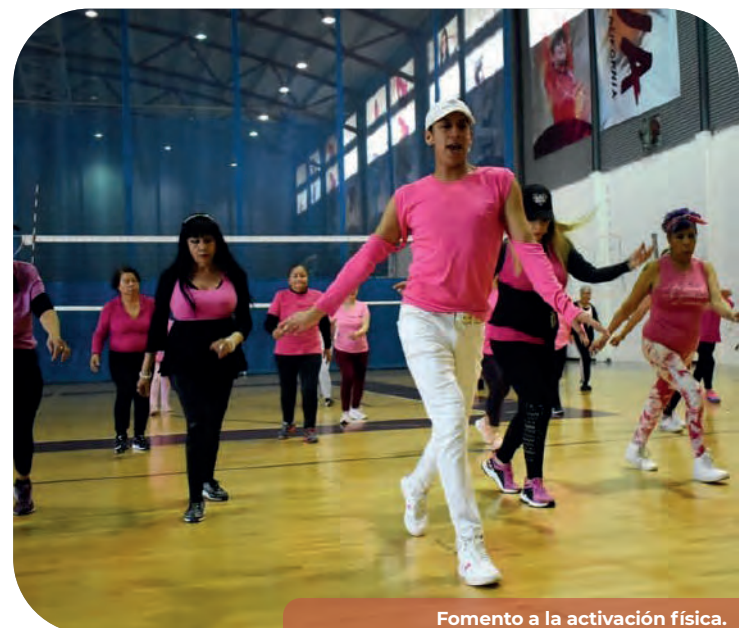
Fomento a la activación física.

El 10 de diciembre de 2023, se celebró en Mexicali el Maratón Baja California en su edición 57, el cual contó con la participación de 966 corredores: 448 de Mexicali, 34 de Tecate, 345 de Tijuana, 15 de Playas de Rosarito, 73 de Ensenada, uno de San Quintín y 50 de fuera del Estado. El evento contó con modalidades