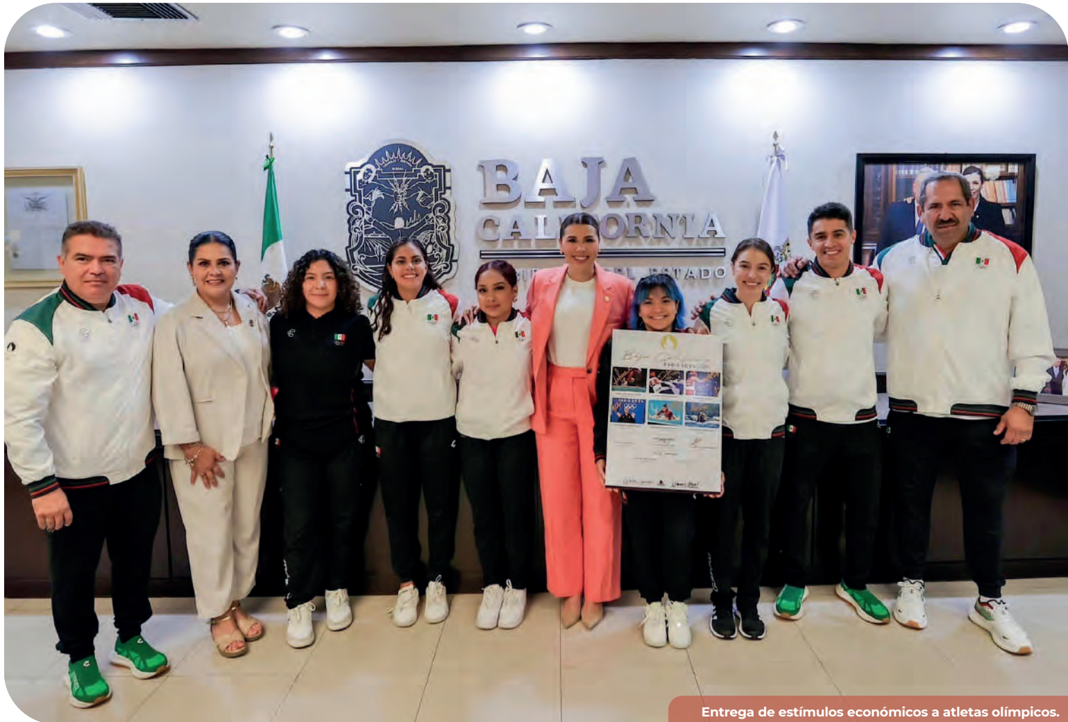
Entrega de estímulos económicos a atletas olímpicos.

En esta Administración la cultura física y el deporte representan un binomio estrechamente ligado que forman parte de una política pública, debido a que son pilares fundamentales para lograr una sociedad más sana e incluyente; tomando en cuenta que nuestros deportistas bajacalifornianos tienen un gran talento para desarrollarse en las diferentes disciplinas deportivas, trabajamos de la mano de los expertos y así potenciar al máximo sus habilidades, obtuvimos grandes resultados en el ámbito deportivo; que impactan en la modificación de estilos de vida sedentarios y migrando a la práctica de la activación física y el