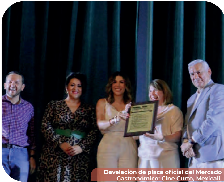
Develación de placa oficial del Mercado Gastronómico: Cine Curto, Mexicali.

Cultural de Baja California, bajo la categoría de sitio histórico al parque público Benito Juárez de la Delegación González Ortega (Palaco) de Mexicali (Contribución ODS 11, Meta 11.4).