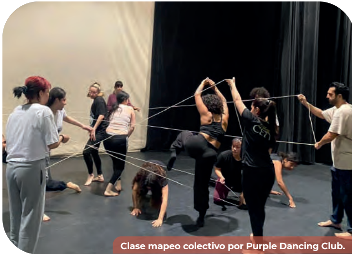
Clase mapeo colectivo por Purple Dancing Club.

Por medio de talleres de iniciación a las disciplinas del arte y presentaciones artísticas, se logró llegar a los centros comunitarios, planteles educativos, albergues, centros de reinserción social, espacios públicos y comunitarios, comunidades indígenas, comunidades con altos índices delictivos, casas hogar y Centros Estatales de las Artes, siendo un total de 38 lugares en los diferentes municipios.