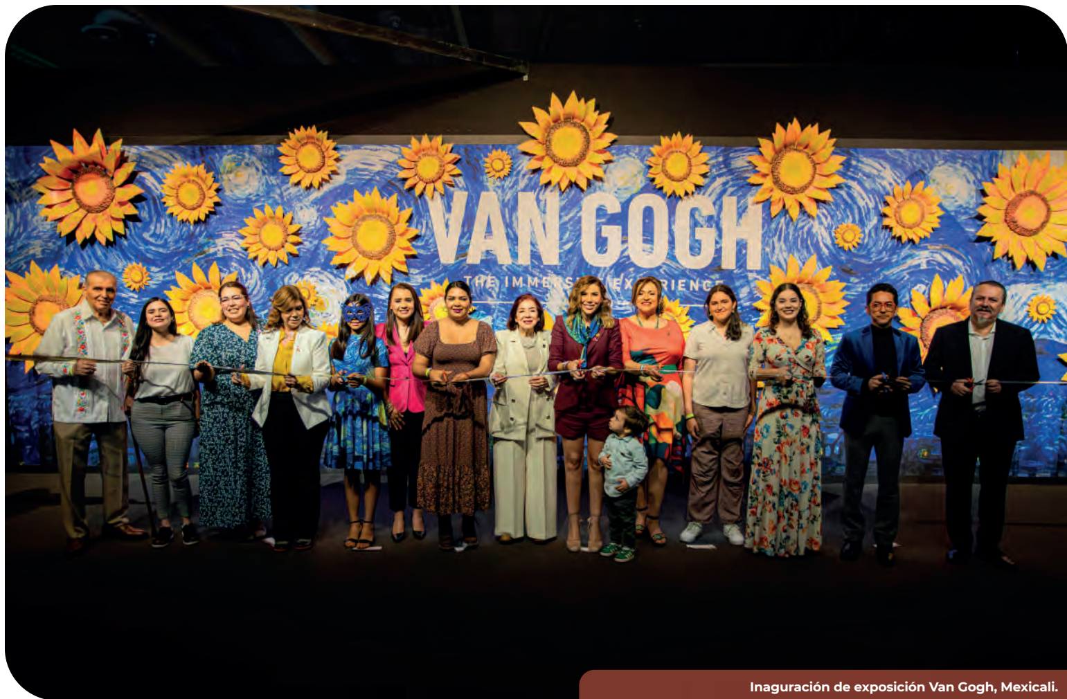
Inauguración de exposición Van Gogh, Mexicali.

En Baja California, se garantiza un acceso equitativo a la cultura impulsando día a día una amplia oferta de bienes y servicios culturales, para aquellas comunidades que se encuentran culturalmente rezagadas; a través de la promoción y el acercamiento a las actividades artísticas y culturales, así como las de formación, mismas que se traducen en beneficio para las niñas, niños, adolescentes, jóvenes, comunidad artística