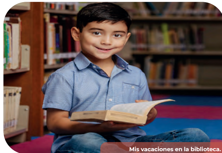
Mis vacaciones en la biblioteca.

En las bibliotecas públicas que integran la Red en el Estado, de noviembre a diciembre de 2023 se atendieron a más de 37