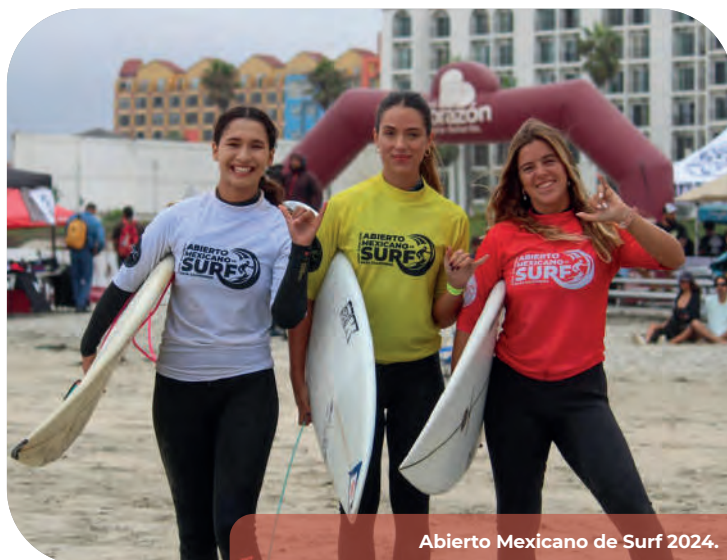
Abierto Mexicano de Surf 2024.

También, realizamos en nuestro Estado el Abierto Mexicano de Surf que se llevó a cabo en septiembre de 2024 en el muelle de Playas de Rosarito, el evento internacional de Taekwondo en el que competieron atletas de Baja California, México, Costa Rica y EUA, así como la Copa Baja Hockey.