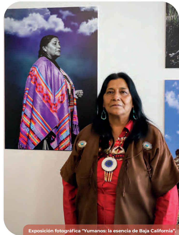
Exposición fotográfica “Yumanos: la esencia de Baja California”.

En diciembre de 2023, se publicó en el Periódico Oficial del Estado, el decreto mediante el que se reconoce como Patrimonio