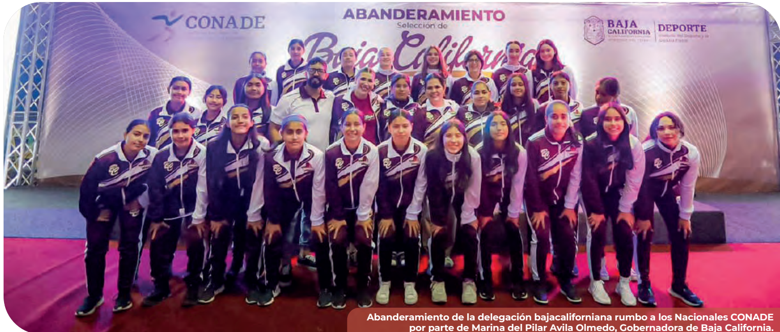
Abanderamiento de la delegación bajacaliforniana rumbo a los Nacionales CONADE por parte de Marina del Pilar Avila Olmedo, Gobernadora de Baja California.

Es indudable que los mejores resultados se obtienen cuando la sociedad y gobierno trabajan de manera conjunta en la consecución de objetivos. En esta edición de Nacionales CONADE 2024, la delegación bajacaliforniana compuesta por niñas, niños y jóvenes reforzados por el cuerpo técnico, fisioterapeutas y ciencias aplicadas al deporte, asistió a la cita que cada año convoca la