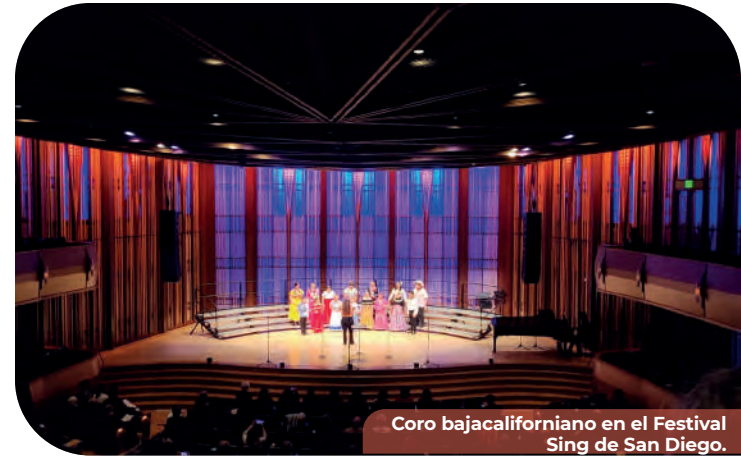
Coro bajacaliforniano en el Festival Sing de San Diego.

Comunitarias en el Marco del “XXII Festival de Octubre”, como parte del “XXIII Festival de Octubre Territorios de Igualdad” en un espacio seguro e inclusivo en el marco del festival más importante del Estado.