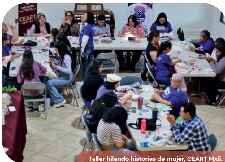
Taller hilando historias de mujer, CEART Mxli.