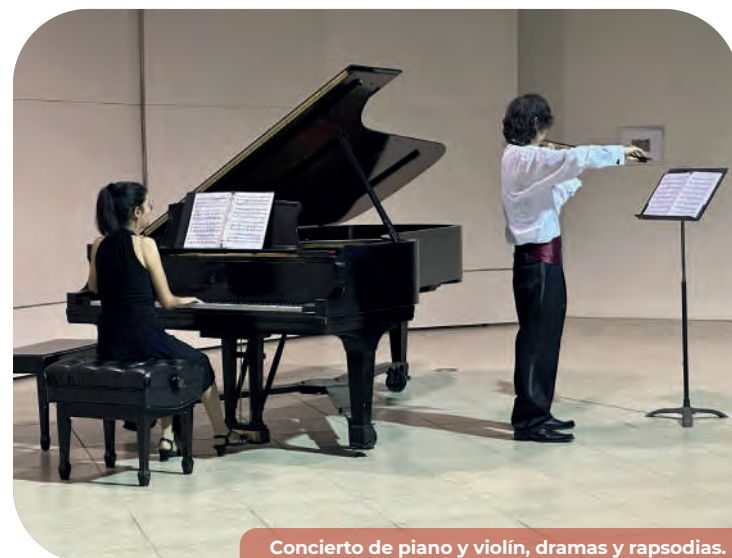
Concierto de piano y violín, dramas y rapsodias.

En mayo de 2024, se presentó en la plaza de las artes una función de artes circenses a cargo de la compañía Malabaría producciones dirigido a toda la familia, asistieron 200 personas entre niñas, niños y adultos.