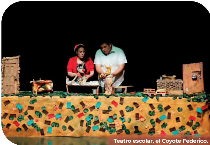
Teatro escolar, el Coyote Federico.

Se atendieron a un total de 621 personas que profundizaron su disfrute de manifestaciones artísticas y culturales a través de actividades de mediación, tales como talleres artísticos, conversatorios con artistas y presentaciones de libros y catálogos de arte, como el libro de fotografía bajacaliforniana “Aquí También es Así”, editado por el artista Gabriel Boils.