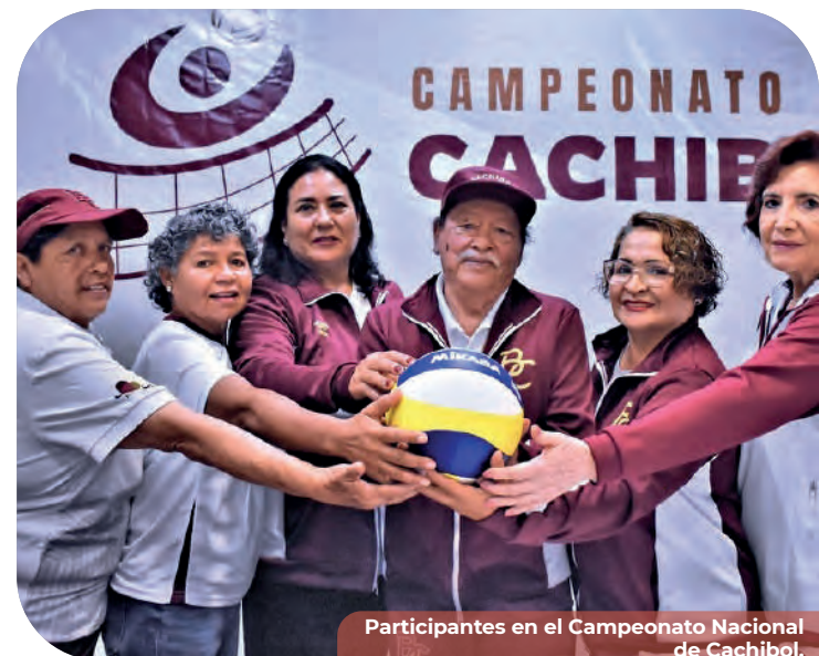
Participantes en el Campeonato Nacional de Cachibol.