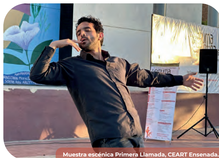
Muestra escénica Primera Llamada, CEART Ensenada.