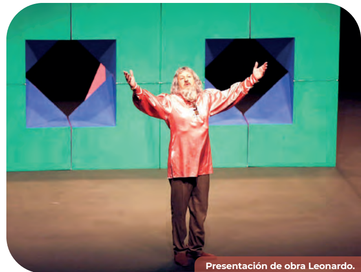
Presentación de obra Leonardo.

A través del programa de Promoción Escolar, atendimos a la población escolar de nivel básico y media superior con propuestas artísticas de calidad y montadas en diversos géneros de las artes escénicas, tales como: teatro, danza y danza aérea, con montajes como “Los Tres Cochinitos”, “Imaginarios”, “El Coyote Federico”, “Los Sueños de Poncho”, “Danza a la Carta”, entre otros. Además, para atender a adolescentes y jóvenes presentamos el grupo de danza “Contracuerpo” en preparatorias del subsistema CECyTE en Tijuana, con un impacto de acercamiento al arte de tres mil 908 NNA.