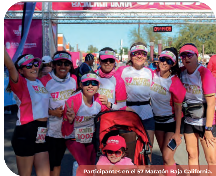
Participantes en el 57 Maratón Baja California.

Asimismo, se crearon siete comités vecinales de noviembre a diciembre de 2023 para llevar a cabo trabajos de vigilancia, mantenimiento y administración de los espacios públicos deportivos, a quienes se les hizo entrega de material deportivo para su desarrollo. De enero a octubre de 2024, se conformaron 18 comités buscando otorgar a la sociedad opciones de actividad