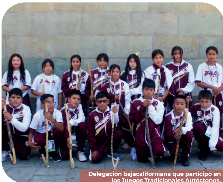
Delegación bajacaliforniana que participó en los Juegos Tradicionales Autóctonos.

En el gimnasio de usos múltiples del CAR Tijuana, se llevó a cabo la ceremonia de abanderamiento de la delegación de Atletas Masters de Baja California que compitió en el Campeonato Nacional de Atletismo de Pista y Campo en Durango, del 18 al 21 de julio del año en curso. Recibieron el estandarte las