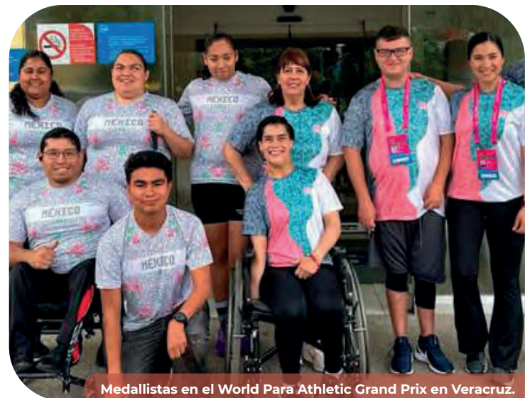
Medallistas en el World Para Athletic Grand Prix en Veracruz.

De igual manera, se participó en el World Para Athletics Grand Prix en Xalapa, Veracruz, en abril de 2024, con la participación de seis para atletas bajacalifornianos. Se posicionó en el pódium