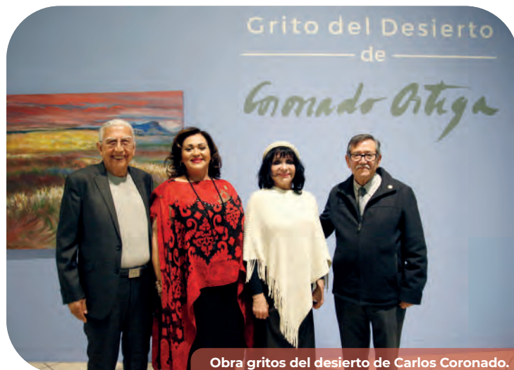
Obra gritos del desierto de Carlos Coronado.

Asimismo, se presentaron exposiciones de artes plásticas y