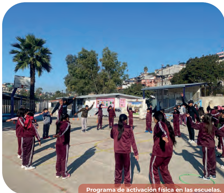
Programa de activación física en las escuelas.

A través de festivales deportivos en escuelas de nivel preescolar, primaria y secundaria, así como la participación del programa Si te Drogas te Dañas en preparatorias, se apoyó con la entrega de material deportivo a 207 escuelas en Mexicali, Tijuana y Ensenada distribuidas de la siguiente manera: 81 primarias, 23 secundarias, 15 preparatorias en Tijuana; tres preescolares, 48 primarias, tres secundarias, cinco preparatorias, dos universidades en Mexicali; atendimos cuatro preescolares, 19 primarias, dos secundarias y dos preparatorias en Ensenada.