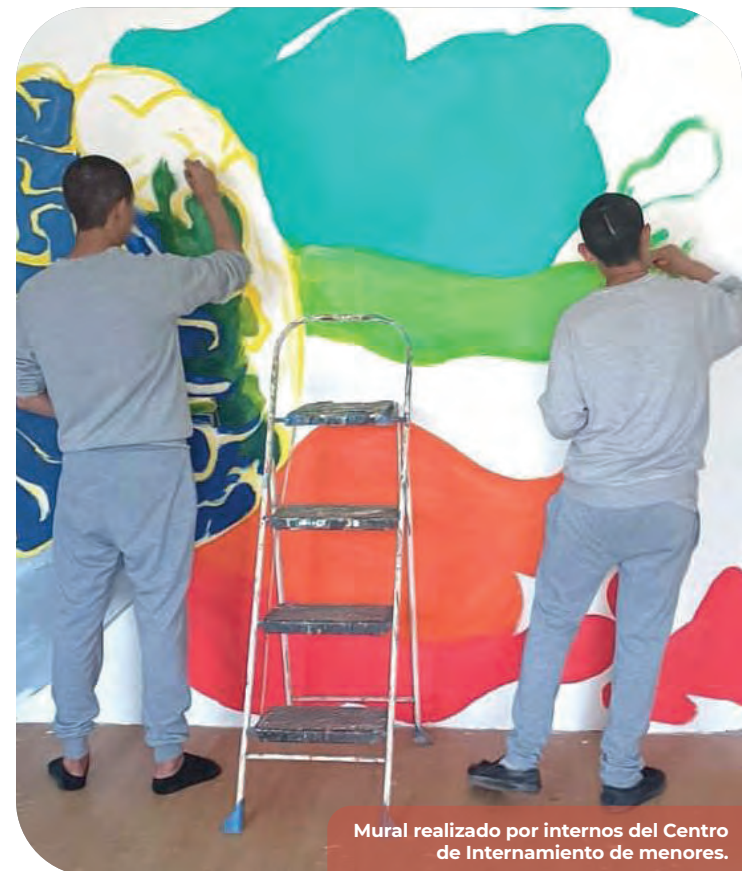
Mural realizado por internos del Centro de Internamiento de menores.

Por ello, el Sistema Estatal de Música (SEM) se erige como un faro de promoción y formación musical que reconoce las expresiones musicales como un componente esencial en la riqueza de nuestra expresión cultural y busca promover, incrementar y mejorar la actividad artística y pedagógica musical en Baja California.