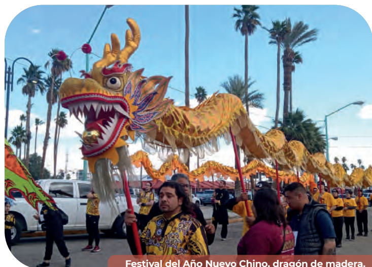
Festival del Año Nuevo Chino, dragón de madera.

Se impulsó la realización de cinco festivales: “Festival del Año Nuevo Chino, Dragón de Madera”, con el objetivo de hermanar la cultura china y visibilizar la importancia de la convivencia intercultural; el “XVII Festival de Jazz, Chinto Mendoza”, con la