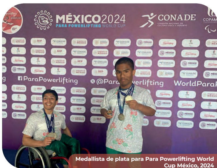
Medallista de plata para Para Powerlifting World Cup México, 2024

En agosto de 2024, se realizó la etapa estatal de los Juegos Paranales CONADE 2024 en el CAR Tijuana, con la participación de 90 atletas en disciplinas de para atletismo, para natación, para powerlifting y boccia. En septiembre