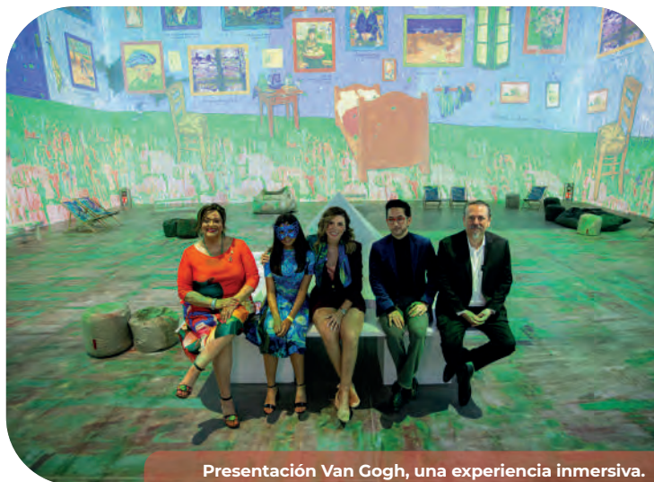
Presentación Van Gogh, una experiencia inmersiva.

Mediante el programa Martes de Cineclub, en la ciudad de Tijuana se presentaron diversas piezas cinematográficas para la apreciación y disfrute de 297 personas.