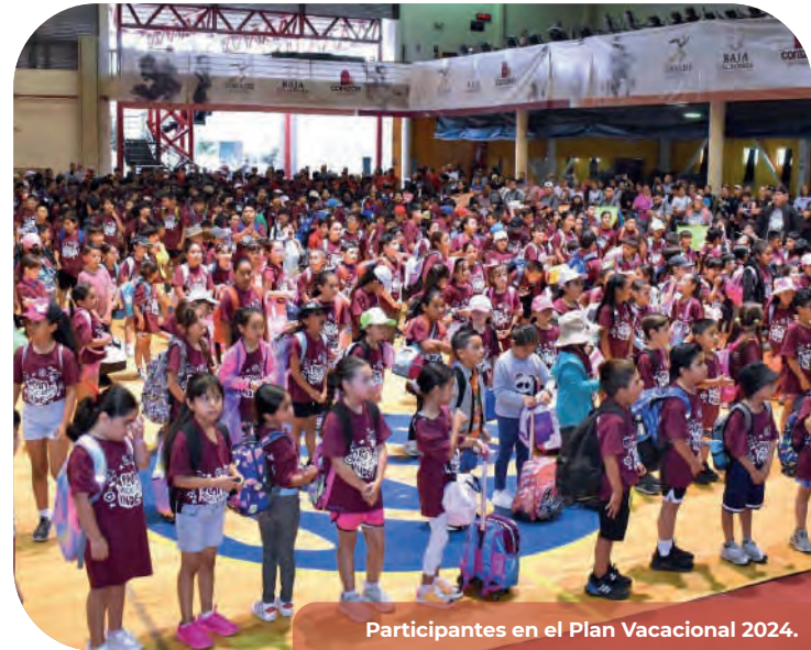
Participantes en el Plan Vacacional 2024.

En los Juegos Nacionales Populares en Oaxaca, celebrados en agosto de 2024, participaron 113 atletas, entrenadores y delegados, compitiendo en disciplinas como boxeo popular,