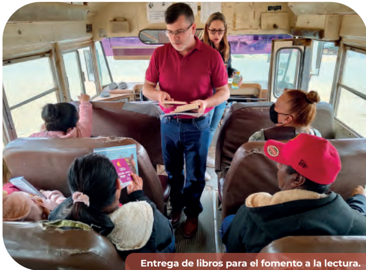
Entrega de libros para el fomento a la lectura.

y bibliotecarios del Estado, para la mejora y amplitud de los servicios en el Estado.