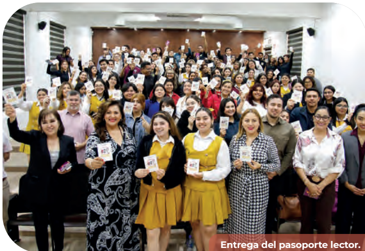
Entrega del pasaporte lector.

iniciaron su preparación con el taller virtual en línea “Apreciación Artística”, como una forma de introducción a los 28 talleres gratuitos presenciales que iniciaron en septiembre y concluirán en diciembre de 2024. Cabe destacar que todos ellos fueron acreedores a becas económicas por un monto de 436 mil 500 pesos.