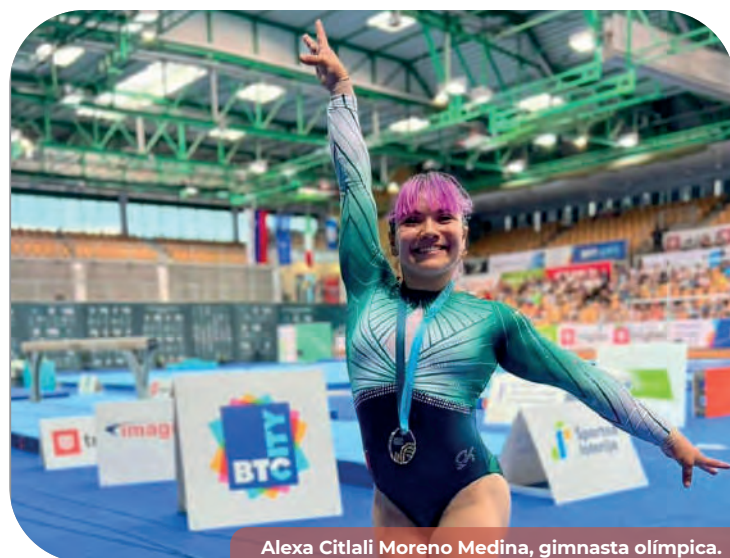
Alexa Citlali Moreno Medina, gimnasta olímpica.

En el evento, se premió a la mejor asociación deportiva por sus logros y su buen control administrativo, quien resultó distinguida fue la Asociación de Luchadores Olímpicos de Baja California A.C, obteniendo un estímulo de 30 mil pesos.