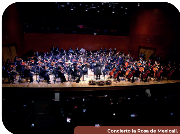
Concierto la Rosa de Mexicali.

Asimismo, se participó en el Festival San Diego Sings en The Conrad Prebys Performing Arts, Concierto Kata Navali Kivina en San Quintín, concierto La Murga Morada de agrupaciones femeninas, Concierto de Aniversario de la Orquesta Infantil y Juvenil Río Nuevo, Aniversario de la Orquesta Infantil y Juvenil El Centinela, concierto del 120 Aniversario de la Delegación González Ortega, Concierto Mi Raíz, Fiesta de la Música, donde festejamos en vinculación con la Alianza Francesa, Aniversario 48 de la Banda de Música del Estado agrupación profesional más longeva y representativa de la entidad. Concierto de cierre campamento musical “EnRedate”, con participación de 71 NNA de colonias de Tijuana y el gran evento “Tengo un Sueño Estatal” con las agrupaciones de la Coordinación Nacional de Fomento Musical y del SEM y los Semilleros Creativos de Baja California con más de 200 participantes de diferentes disciplinas de Mexicali, Tijuana, Playas de Rosarito, Ensenada y San Quintín, la participación en el “Festival de Jazz Chinto Mendoza” sede Ensenada y el “Día de la Música” en el Jacob Music Center de San Diego y Conciertos de las Agrupaciones