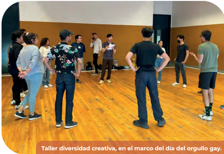
Taller diversidad creativa, en el marco del día del orgullo gay.

y asilos de ancianos, con las cuales se logró atender a 15 mil 387 personas, en los Centros Estatales de las Artes, así como en el Centro de Rehabilitación en Tecate.